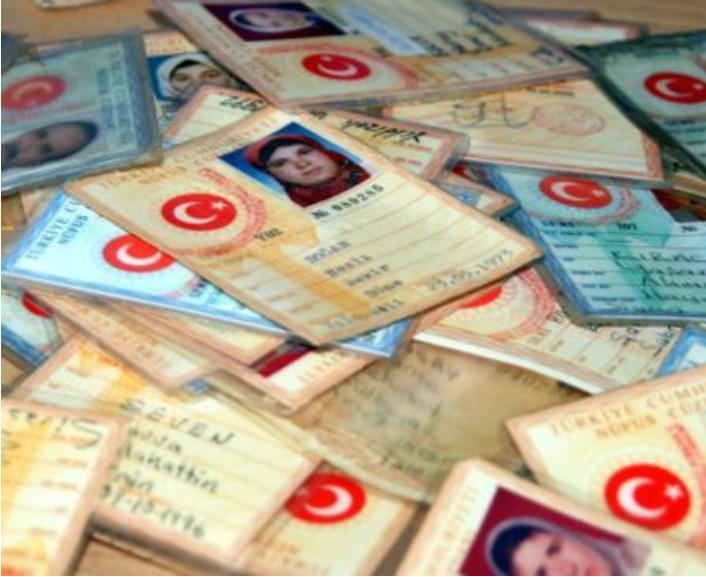
Türkiye'de ilk nüfus cüzdanı: 1863-64'te yapılan sayımdan sonra verildi.