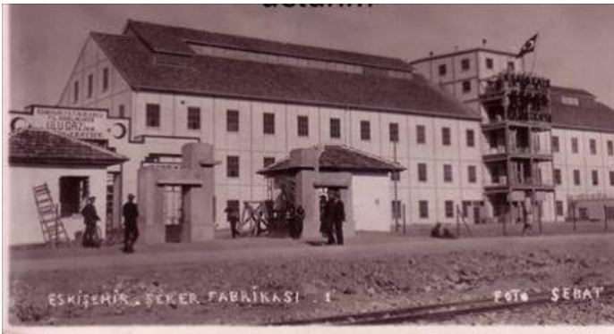
İlk Şeker Fabrikası: 1926 yılında ilk şeker Üretildi. O zamana kadar şeker pancarının ne olduğu dahi bilinmiyordu.