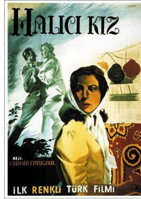
İlk renkli filmi 1953'te Halıcı Kız adıyla Muhsin Ertuğrul çekti.