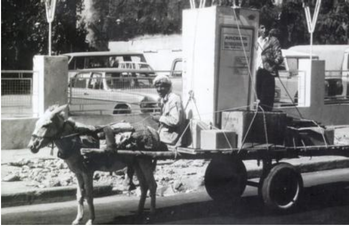
İlk yerli Buzdolabı : 1960 yılında üretildi.