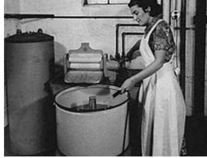
İlk Çamaşır Makinesi : 1960 yılında üretildi.