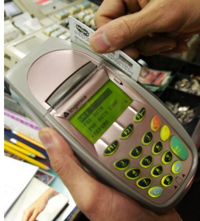
Türkiyede ilk kredi kartı kullanımına Aralık 1991 yılında başlandı.