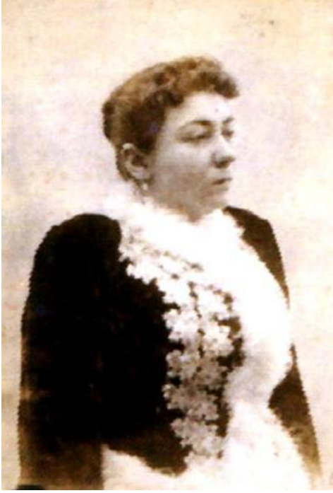
Türkiye'nin ilk kadın yazarı: Cevdet Paşa'nın kızı Fatma Aliye'ydi.