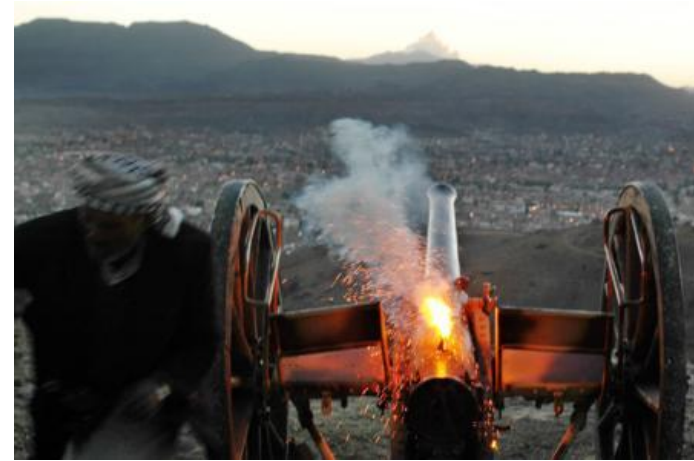
İftar topu uygulaması Sultan III. Mustafa döneminde (1757- 1774) uygulanmıştı.