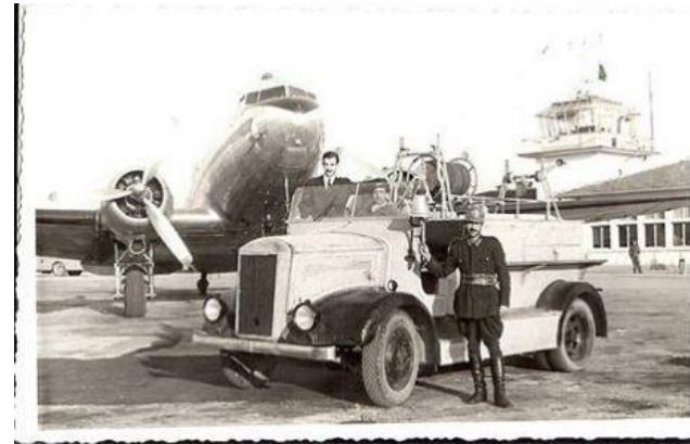
Havayolu ulaşımı: 1933'te başladı.