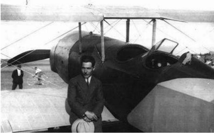
İlk Türk Uçağı: 1934 yılında Kayseri'de monte edilmiştir.